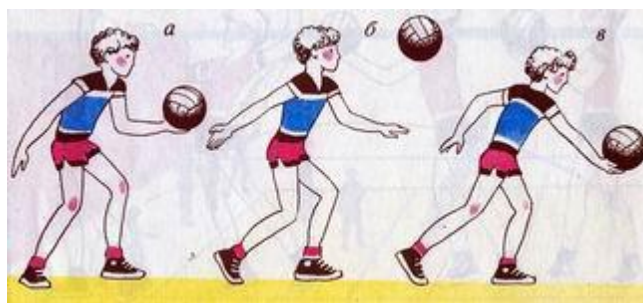
Рисунок 1 – Нижняя прямая передача

Нижняя прямая подача (см. рис. 1) выполняется из положения, при котором игрок стоит лицом к сетке, ноги в коленных суставах согнуты, левая выставлена вперед, масса тела переносится на правую стоящую сзади ногу. Пальцы левой, согнутой в локтевом суставе руки поддерживают мяч снизу. Правая рука отводится назад для замаха, мяч подбрасывается вверх-вперед на расстояние вытянутой руки. Удар выполняется встречным движением правой руки снизу-вперед примерно на уровне пояса. Игрок одновременно разгибает правую ногу и переносит массу тела на левую. После удара выполняется сопровождающее движение руки в направлении подачи, ноги и туловище выпрямляются.